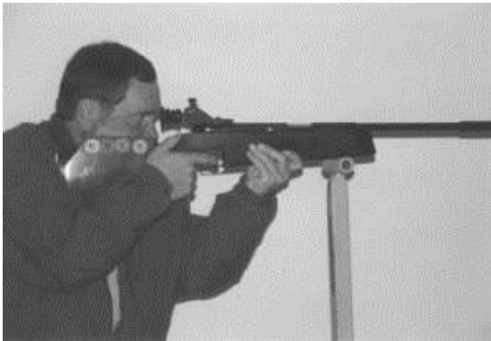
Abb.1 – Anschlag stehend aufgelegt

Die Zuhilfenahme sonstiger Stützen bzw. Anlehnen von Körper oder Körperteilen ist nicht gestattet (siehe Abbildung 2). Zwischen Abzugsbügel und Auflage muss ein deutlich sichtbarer Abstand sein.